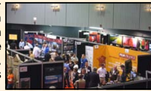
The Location Trade Show

Le Location Trade Show est le plus grand salon international des Commissions du Film (260 exposants venus de plus de 30 pays à travers le monde, ce salon est le rendez vous annuel des professionnels de l'industrie cinématographique, il est organisé par l' AFCI (Association of film commissioners international). Notre structure a répondu à l'invitation de la Commission Nationale du Film France et s'est inscrit aussi dans le cadre d'une opération Tourisme-Cinéma menée à l'initiative de la Chambre de Commerce et d'Industrie de Marseille Provence (CCIMP). La préparation