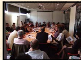
Réunion du réseau national des commissions du film

Cette année du 16 au 27 mai s'est déroulé le 60 ème Festival International du Film de Cannes. Le Bureau du Cinéma Luberon Vaucluse se devait d'y être présent pour plusieurs raisons. La première étant la présence de toutes les commissions du film ( 37 commission couvrant le territoire français ) et la tenue d'une réunion de notre réseau difficilement envisageable dans un autre contexte. Nous avons également participé à l'organisation d'un Cocktail sur le stand de la Région Provence Alpes Côte d'Azur en amont de cet événement des partenariats ont été conclus par notre structure.