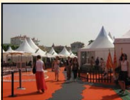
Village international La Pantiero

En conséquence, une dégustation des produits du Vaucluse a pu être proposer grâce à nos partenaires que nous remercions pour ce moment convivial: Le Groupeement Commercial et Artisanal du pays d'Apt, le Château La Canorgue, la Chambre d'Agriculture de Vaucluse et Kerry Aptunion.